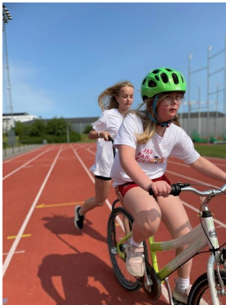
Full koncentration när balansen tränas!

Våra cykelläger är en mycket uppskattad och framgångsrik aktivitet och många är de nya cyklister som inte skulle ha fått chansen att cykla tvåhjulning utan JagKanCykla.