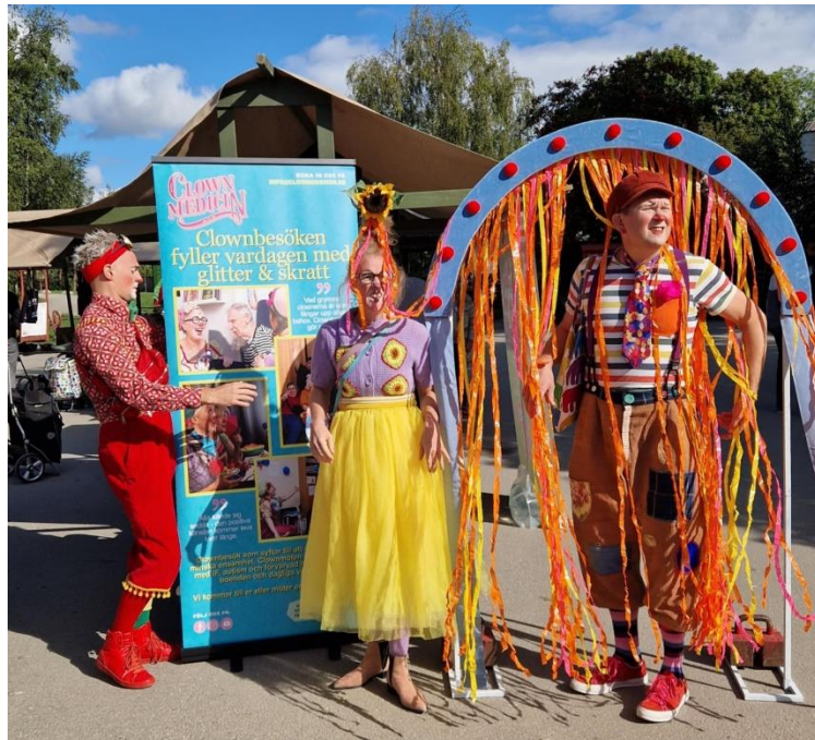
Clowner från Clownmedicin underhöll på Skansen för alla i augusti