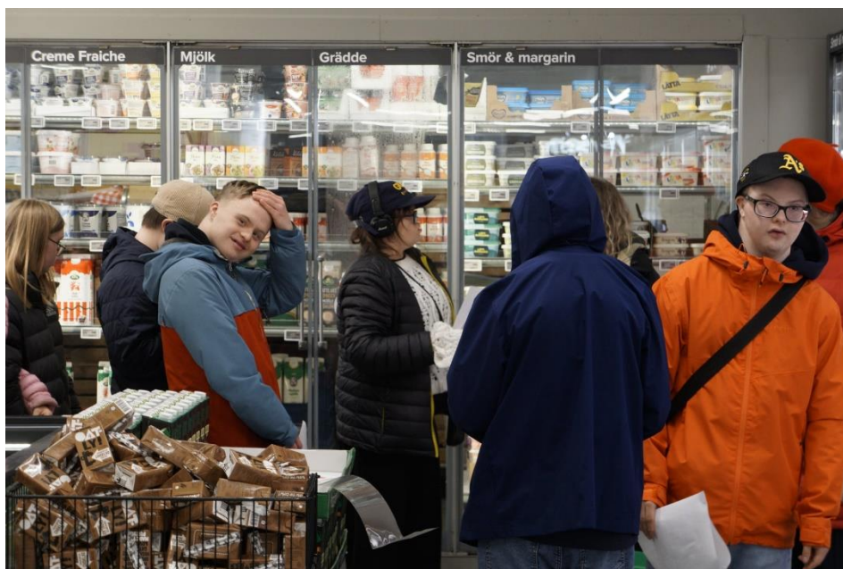
Ungdomsgruppen handlar och lagar själva sin middag varje gång de ses.

Vi har gjort av med mer pengar än vi räknat med under året.