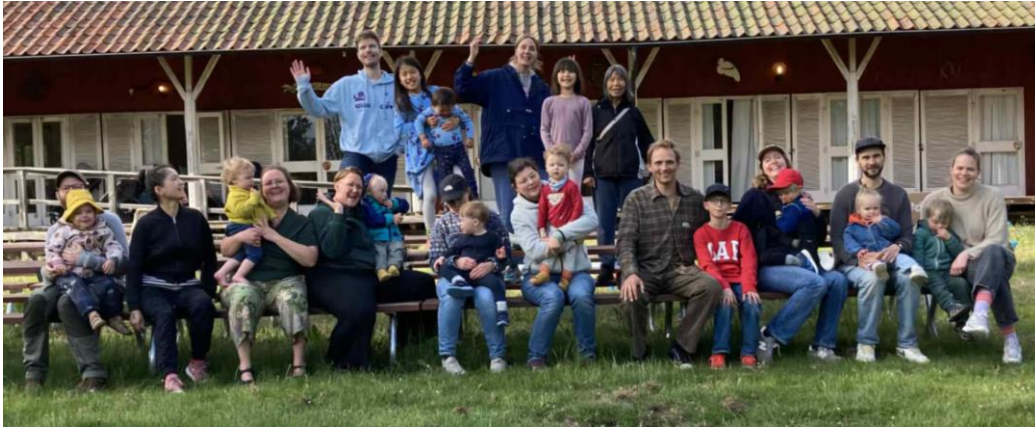
Familjerna på Åhléngården på Barnens Ö.

Det var mycket uppskattade dagar fyllda av lek, teckenutbildning, samtal och fint umgänge. Mycket tack vare de erfarna ledarna på Stiftelsen Barnens Dag.