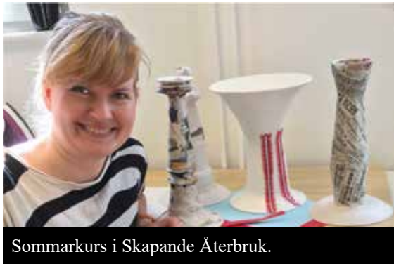
Sommarkurs i Skapande Återbruk.