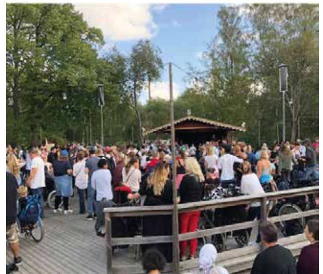
Full fart på dansbanan på Skansendagen 2018.