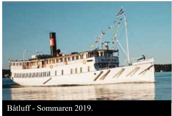
Båtluff - Sommaren 2019.

Anmälan till sommaraktiviteterna görs till: www.sv.se/stockholm eller ring 08-679 03 30. Uppge om du är FUB-medlem vid anmälan. Sista anmälningsdag är den 24 juni.