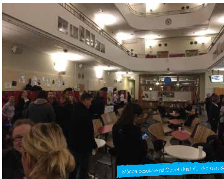
Många besökare på Öppet Hus inför skolstart 8/11

Nu laddar vi för nya spännande aktiviteter under våren 2017, varav några finns med redan i detta brev.