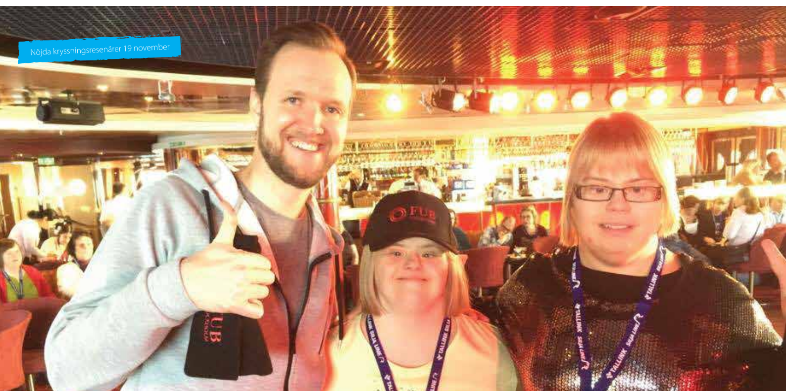
Nöjda kryssningsresenärer 19 november